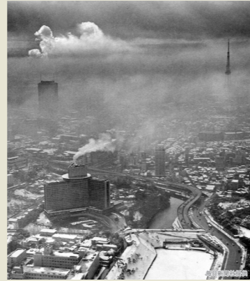
スモッグで覆われた東京

都市を中心に大気汚染が発生。「公害対策基本法」「大気汚染防止法」が公布され、工場や発電所からの汚染物質をはじめ、自動車から排出されるHC(炭化水素)、CO(一酸化炭素)、NOx(窒素酸化物)を減らすことが急務となりました。