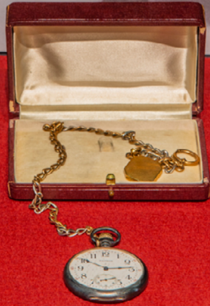
豊田佐吉の懐中時計(ウォルサム製)

Mr.Sakichi Toyoda's pocket watch(made in Waltham)