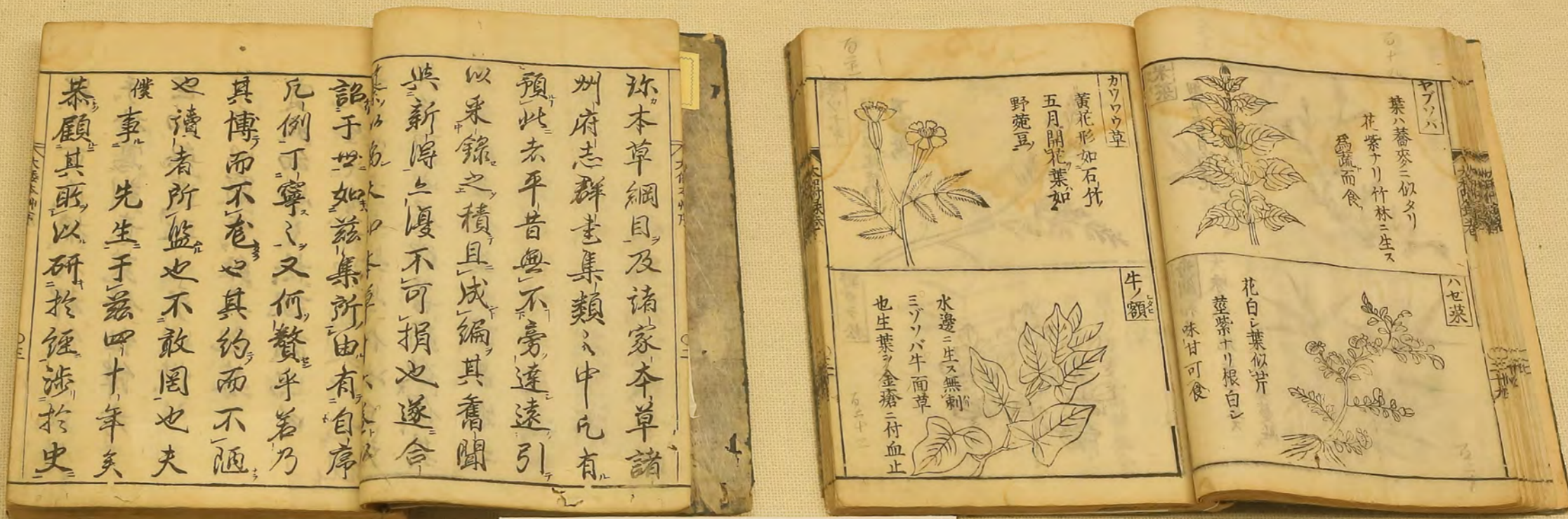
やまとほんぞう がいげんえきけん 『大和本草』 貝原益軒・著 Domestic plant guidebook of biology & agriculture 江戸中期になると、中国に学ぶだけでなく、日本人の体質に合い、日本で採れる新たな薬草の研究を志向する者たちが現れました。その一人が、貝原益軒。日本独自の本草学は、彼が著した「大和本草」によって、その第一歩を踏み出したと言っても過言ではありません。 1709年 内藤記念くすり博物館 所蔵