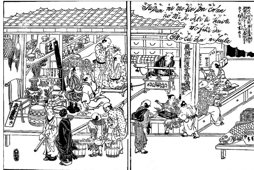
多くの種類の舶来品が並ぶ(摂津名所図絵より)

大坂・伏見町にある蝙蝠堂は、エレキテル、ガラス製品、磁器、壺などの舶来品が置かれ、通行人の注目を浴びていました。異国の奇品が大坂で買えることを強調しています。