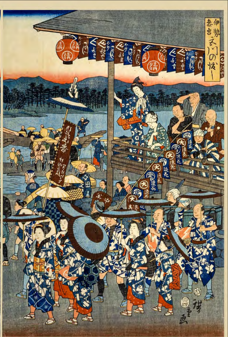
伊勢参宮宮川渡しの図