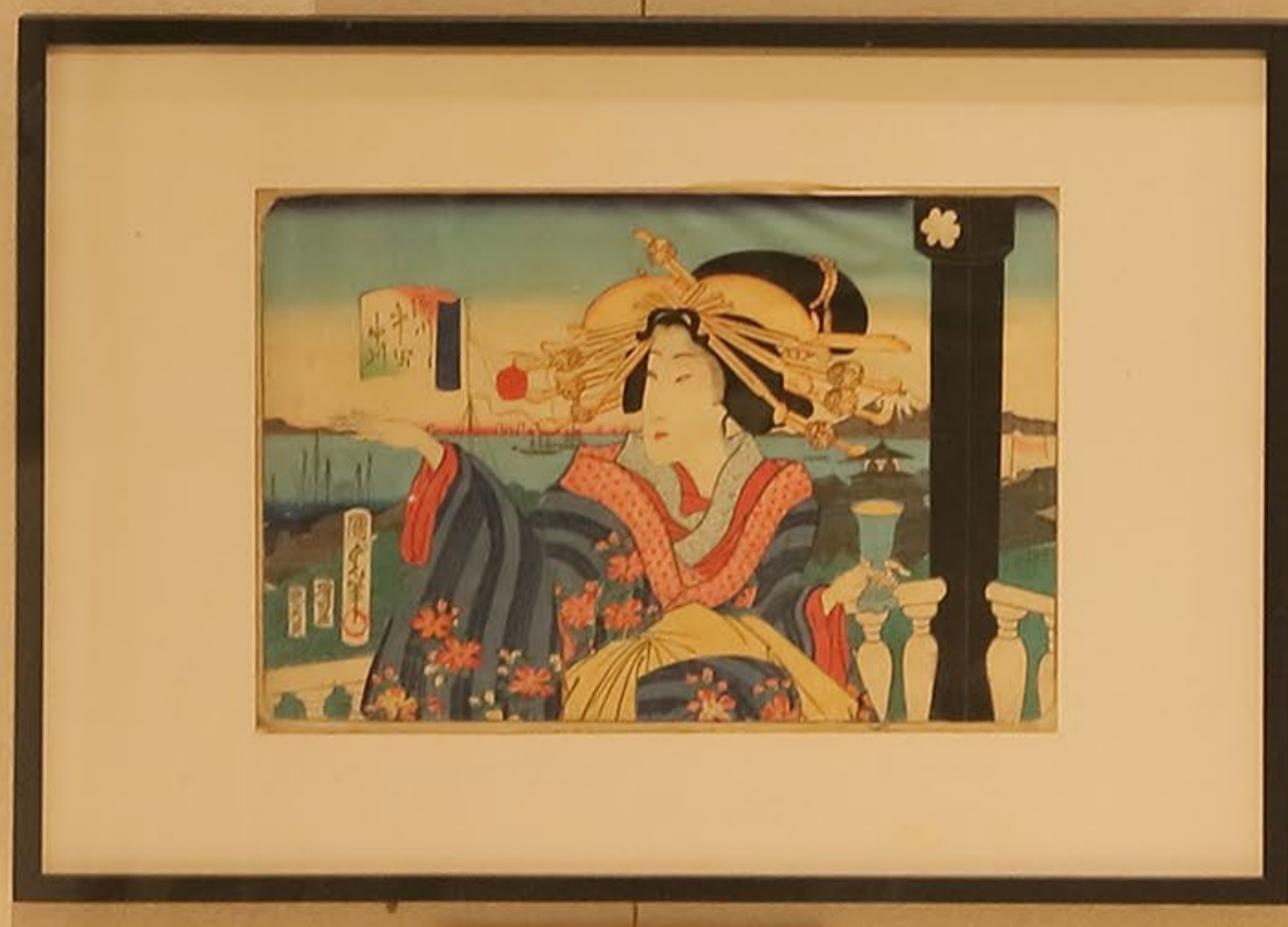
107 深川 中祀 中川（木版画） Courtesan holding a glass(woodcut) ビードログラスを持った花魁を描いています。ガラス器が重宝がられた様子が うかがわれ、画面から異国情緒を感じとることができます。