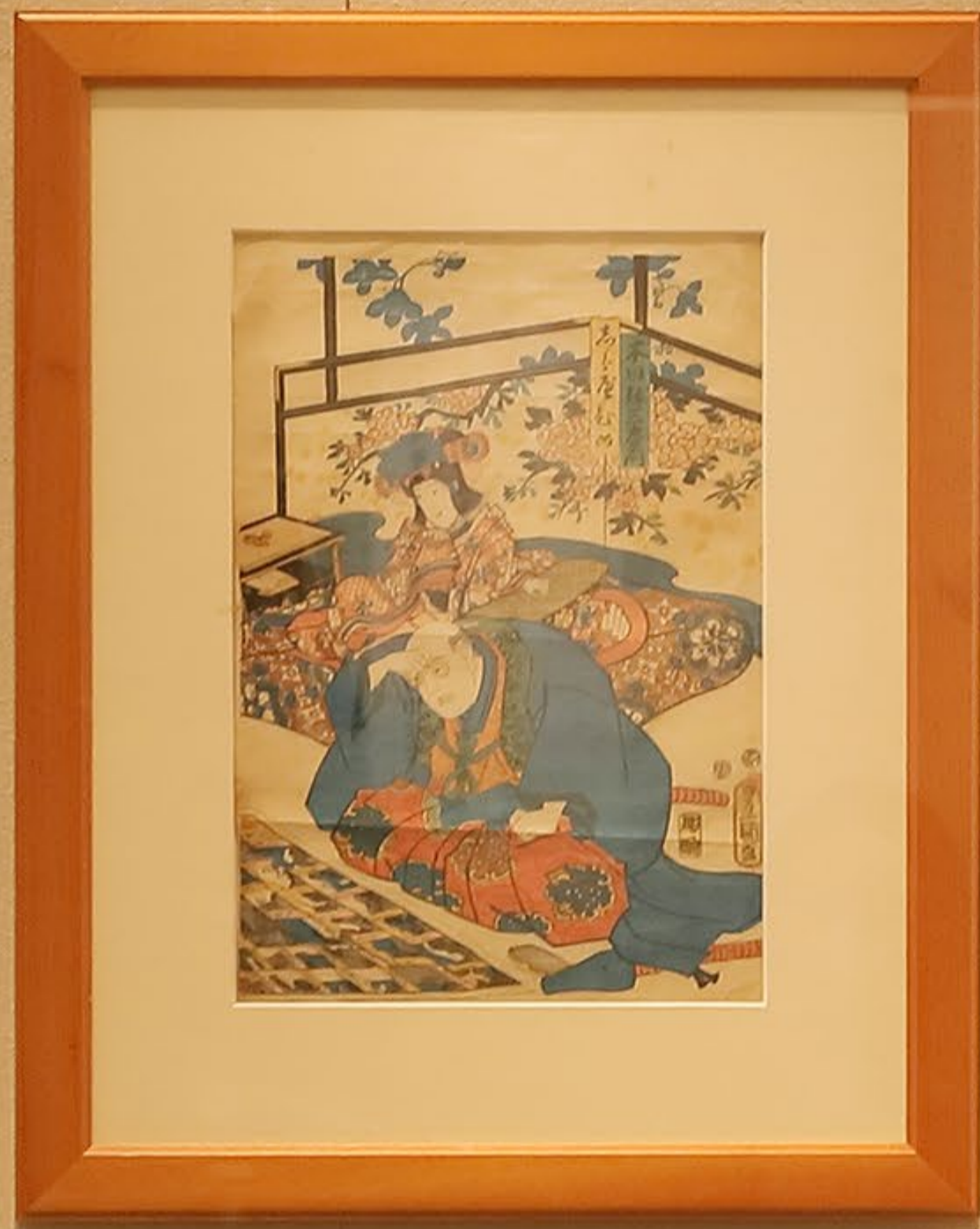
106 眼鏡の家老と志らべ姫（木版画） Chief retainer using a reading glasses(woodcut) 家老が双六で志らべ姫のご機嫌をとろうとしている図。 当時、眼鏡が一般的なものであったことがわかります。 豊国作 江戸後期