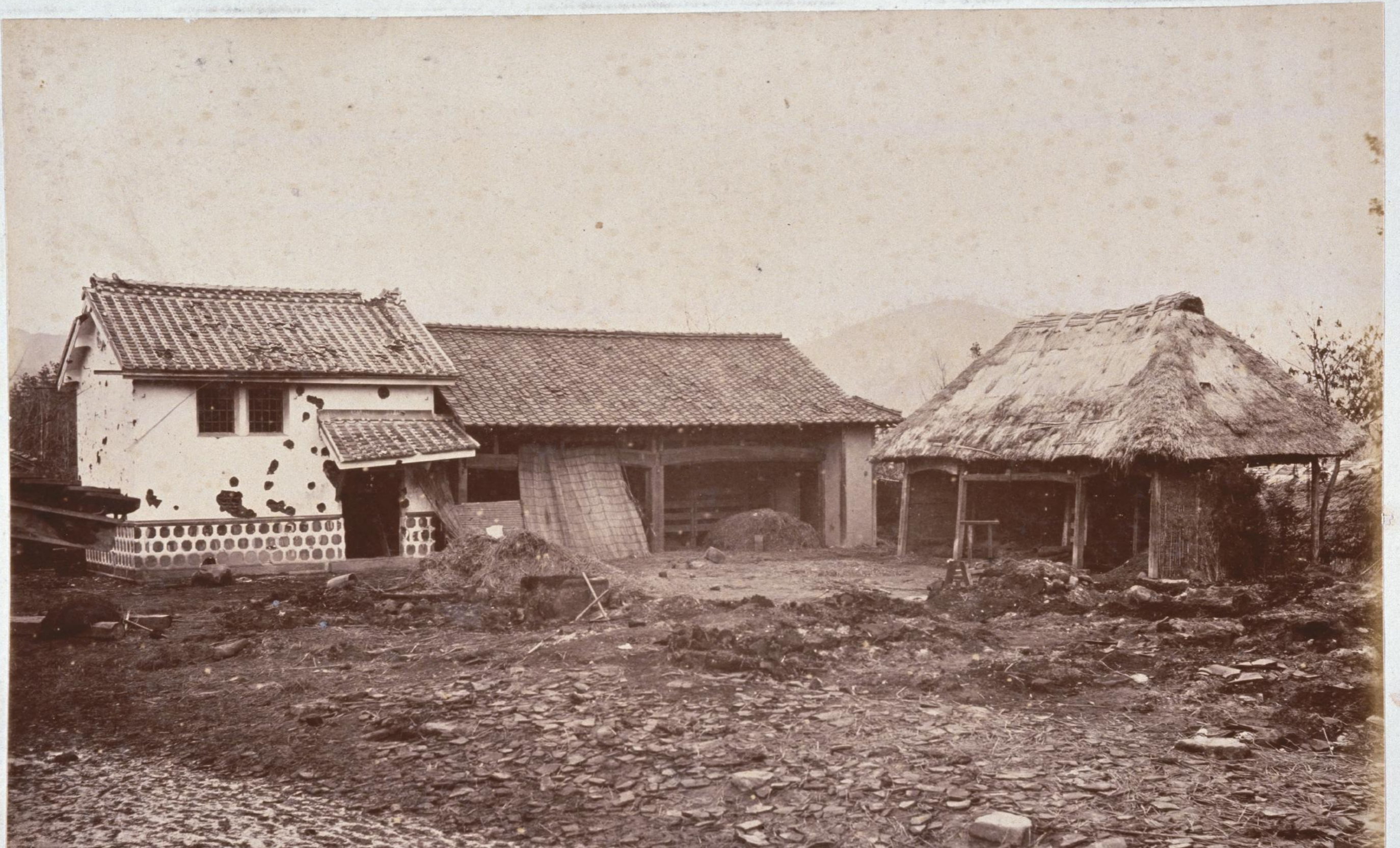
西南戦争の激戦地・田原坂の弾痕が残る土蔵賊壘