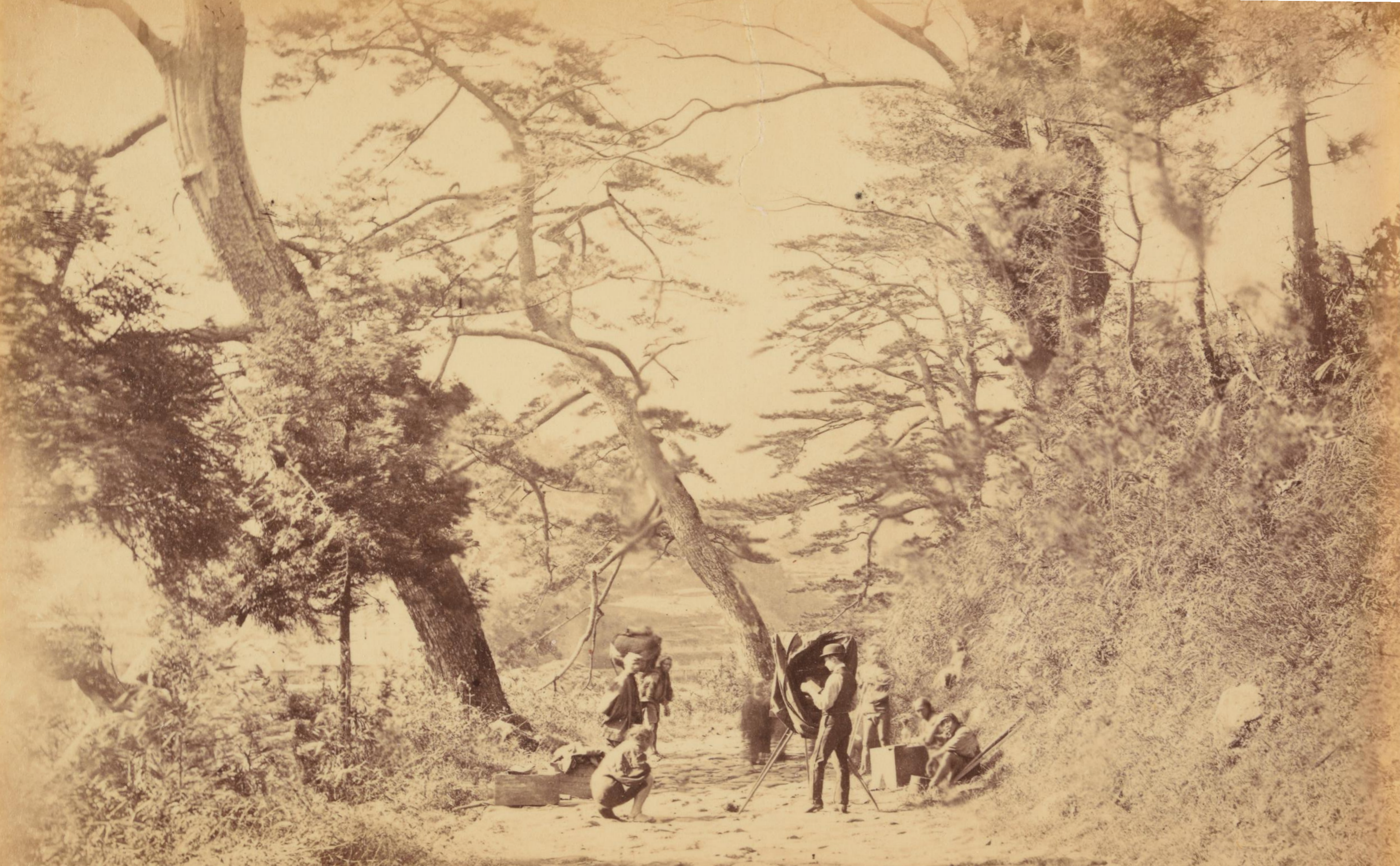
東海道での撮影風景