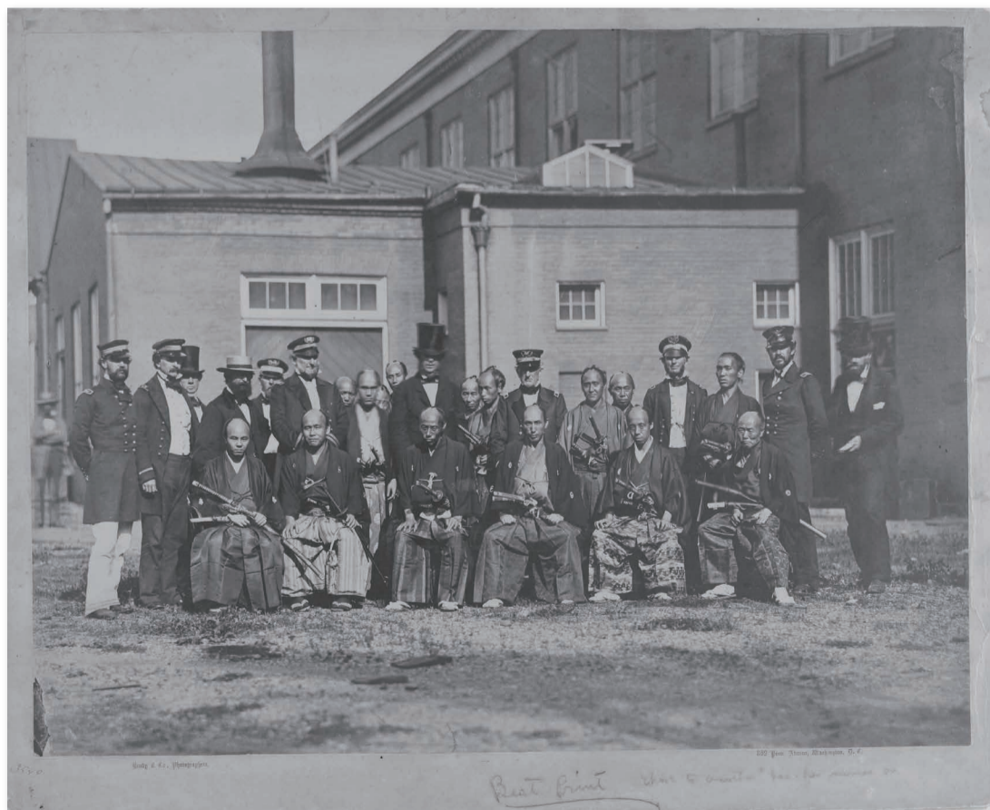
ワシントン海軍工廠を訪問した 遣米使節団の幹部たち

自国経済からグローバル経済へ。米国の軍事力の脅威を背景にした開国は、日本を力に屈しない国へと向かわせる富国強兵政策へとつながり、戦国時代の武力による世界に舞い戻りました。