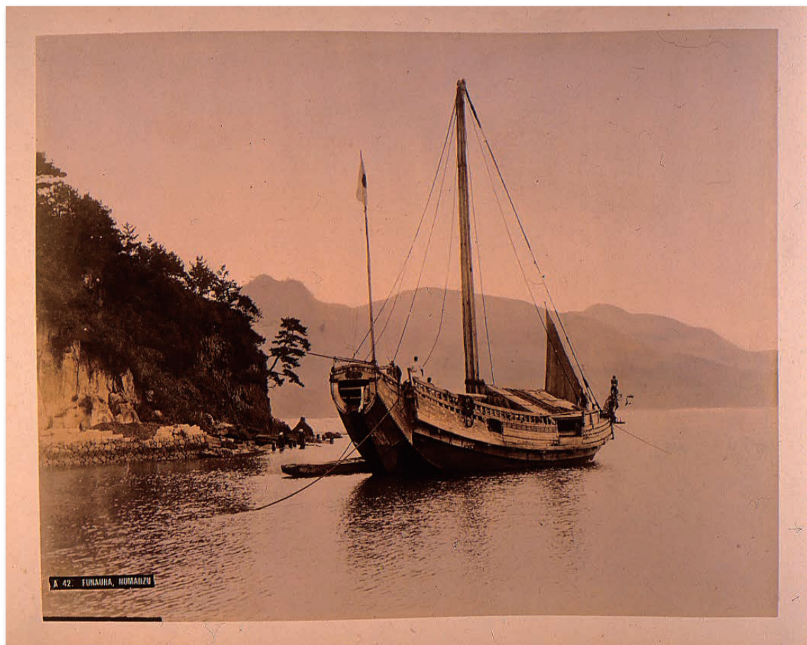
沼津の荷船

元々、謀反を起こした大名に討伐軍を派遣しやすくするために整備した五街道。やがて、それは参勤交代の制度により街道筋や宿場に膨大なお金を落としました。また、船上交通である廻船も盛んに運行され、物流を支えました。ヒト、モノ、カネ、それに加えて江戸文化という情報、これらが国内を循環し、国中が豊かになっていきました。まさに【移】によって価値をもたらしたのです。