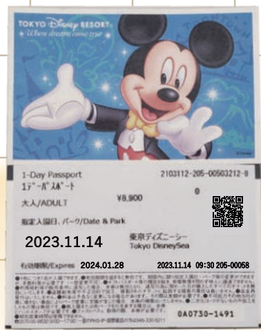
▶ テマパークの入場券