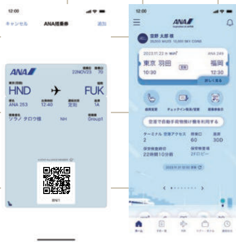
▶ 航空会社の搭乗券