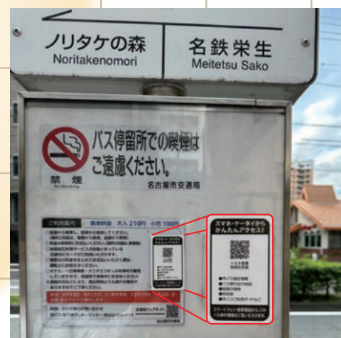
▶ バスの運行状況の確認