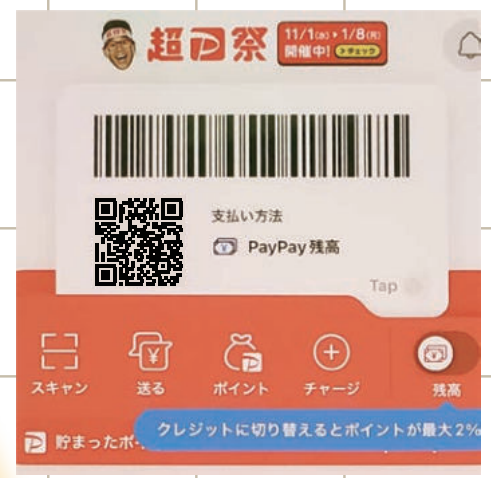
▶ QRコード決済サービス