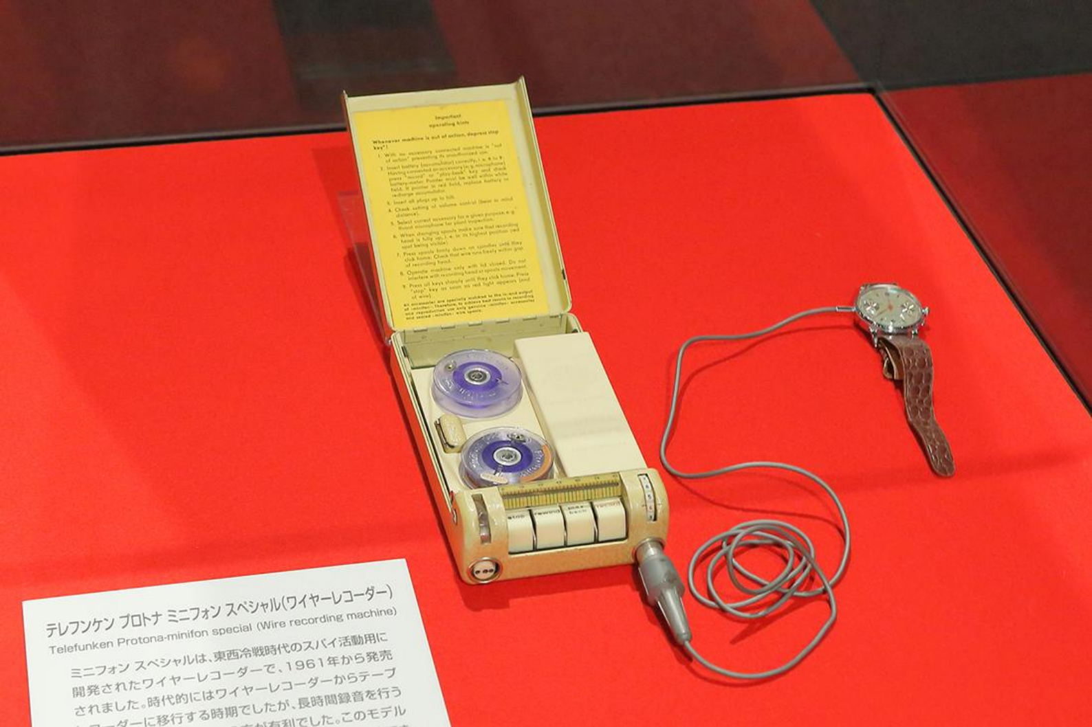
テレフンケン プロトナ ミニフォン スペシャル(ワイヤーレコーダー) Telefunken Protona-minifon special (Wire recording machine)

ミニフォン スペシャルは、東西冷戦時代のスパイ活動用に開発されたワイヤーレコーダーで、1961年から発売されました。時代的にはワイヤーレコーダーからテープレコーダーに移行する時期でしたが、長時間録音を行うワイヤーレコーダーに移行する時期でしたが、長時間録音を行うのが有利でした。このモデル