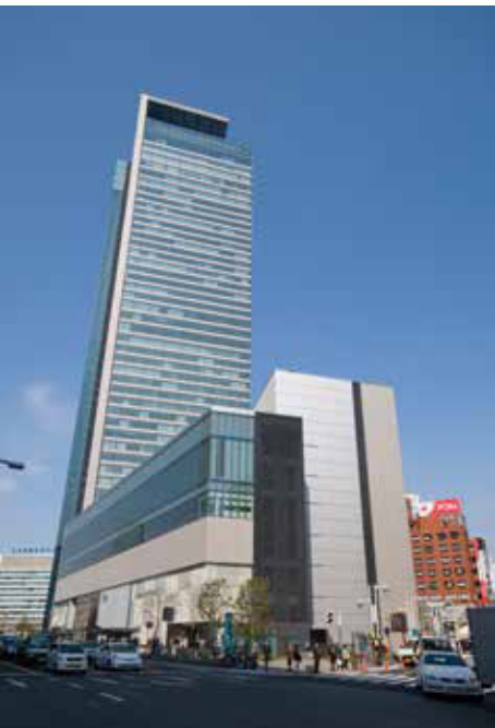
ミッドランドスクエア MIDLAND SQUARE