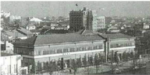
豊田会館 TOYODA KAIKAN

Main Business : Building holdings and management, Investment in securities