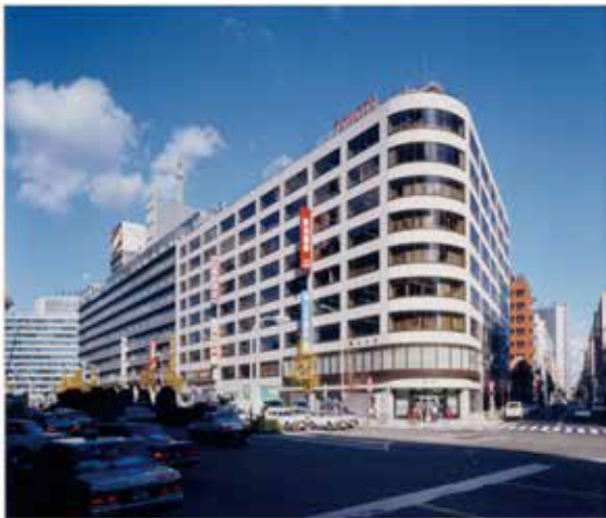
豊田ビル TOYOTA BUILDING