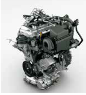
HVエンジン HV engines