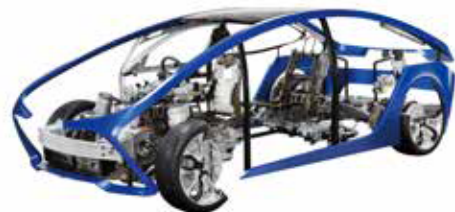
自動車部品 Automotive parts