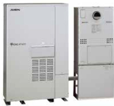
エネルギー関連製品 Energy system related products