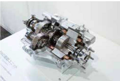
電気式4WDユニット Electric 4WD unit