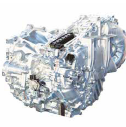
ハイブリッド部品 Hybrid units