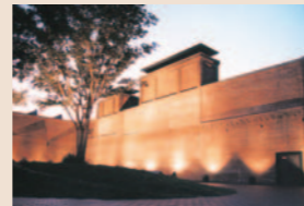
Garten der Treibkraft

[Grundstück] 41,600 m 2 [Geschoßfläche] 27,100 m 2 [Ausstellungsfläche] 14,300 m 2