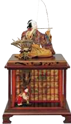
9. 弓曳童子 (田中久重作)