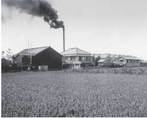
1 . 豊田自働織布工場