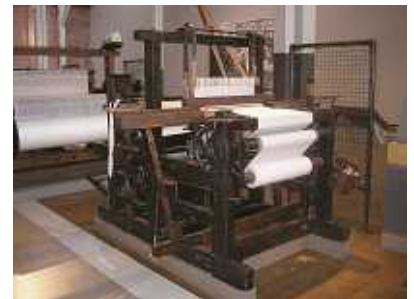
5 . 豊田式汽力織機