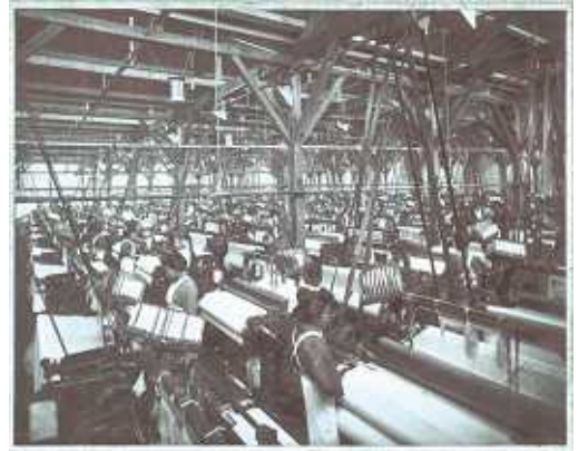
2 . 豊田自働織布工場