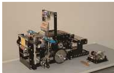
8 . G型自動織機の機構モデル