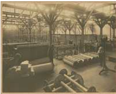
3 . 豊田自働織布工場