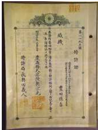
4 . 木製人力織機特許証