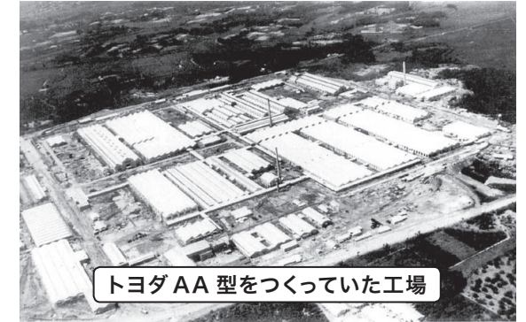
トヨタ AA 型をつくっていた工場