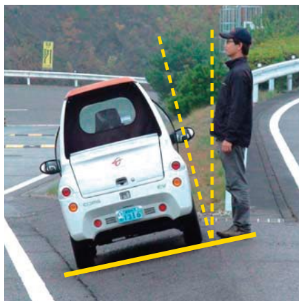
4輪車 4-wheel vehicle