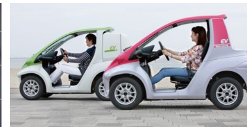
走行中のCO 2 排出“ゼロ” Zero emission of CO 2 and pollutants while driving