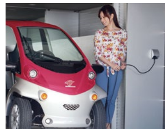
家庭用コンセント(AC100V)で充電可能 Rechargeable from home power outlets(AC100V)