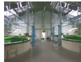
ツナドリーム五島種苗センター 施設内 Inside of Tuna Dream Goto Juvenile Center

Support from Kindai University, a pioneer of the farming industry