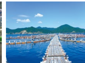
ツナドリーム五島 中間育成用の生簀 Fish preserve for intermediate cultivation at Tuna Dream Goto