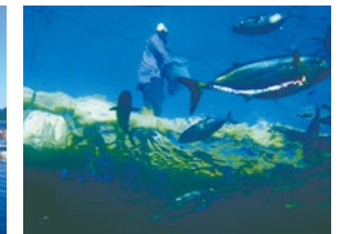
餌やりの様子 Scenes of feeding