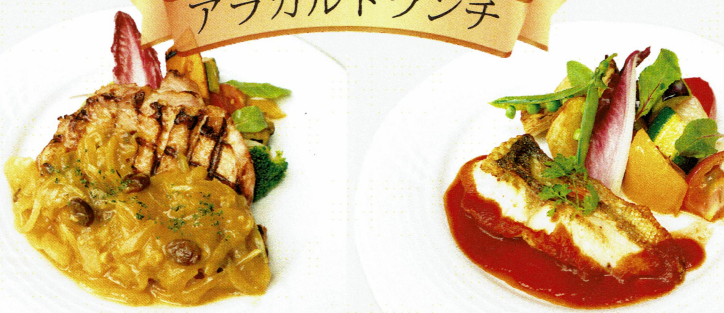
～若鶏のグリル カレーソース～ サラダ、パン又はライス付（メインのお料理を上記写真より1つお選び頂きます） ¥1,300 (税込)