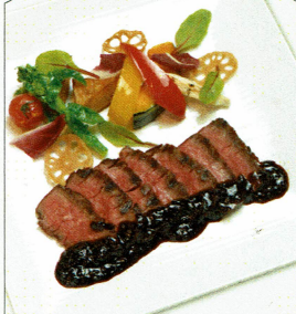
牛ハラミグリルランチ サラダ、パン又はライス、プチデザート付 ¥1,750 (税込)