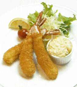
手仕込み パン又はライス付 特製エビフライランチ ¥1,500 (税込)