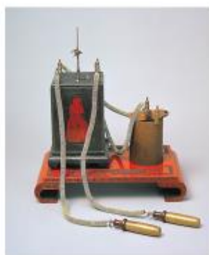
▲佐久間象山作エレキテル